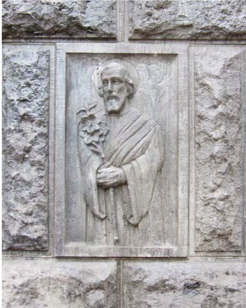
Sint Jozef, Singel 375, Amsterdam

Dat God hem zou belonen voor al zijn harde werk, en wij zijn naam vereren in heel Gods wereldkerk. Sint Jozef blijft ons voorbeeld van goede echtgenoot, van vaderlijke liefde en hulp in alle nood.