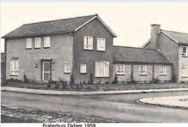
Fraterhuis Didam 1959

Bronnen: Archief Fraters van Utrecht website Oudheidkundige Vereniging Didam website De Gelderlander