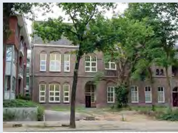
Het Piusgesticht nu, zoals herbouwd na de brand van 2000 en ingepast in de nieuwbouw van appartementencomplex het Kwadrant