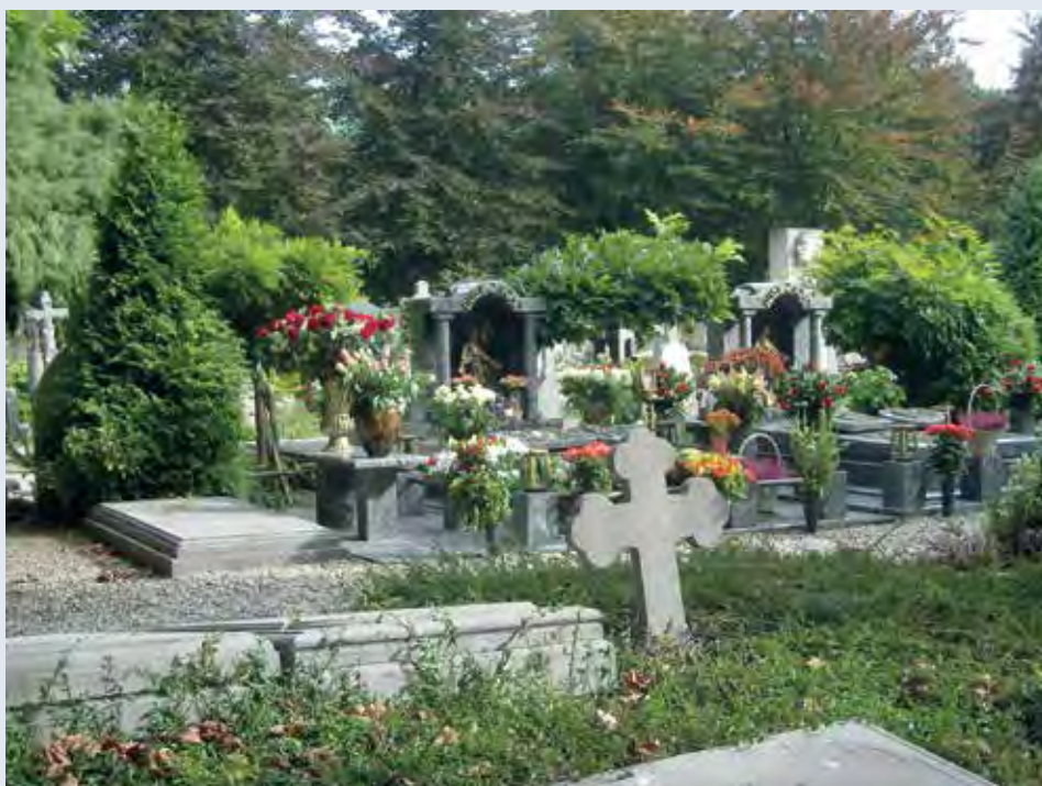
Begraafplaats St. Barbara Utrecht