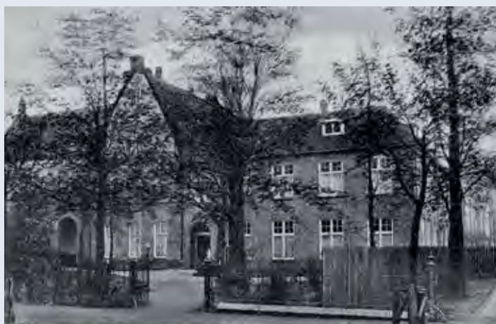
Het Piusgesticht zoals het was bij het begin van het BLO in Didam in 1936

Maar ook de Fraters van Utrecht werden vanaf 1936 pioniers voor het Buitengewoon Lager Onderwijs. De zusters van J.M.J. gaven buitengewoon onderwijs aan meisjes van 7-13 jaar, maar ook de jongens moesten dit onderwijs ontvangen. De zusters namen contact op met het congregatiebestuur van de Fraters van Utrecht, dat volle medewerking gaf en zo kreeg Didam de primeur van de eerste Streekschool voor Buitengewoon Onderwijs. Na een klein jaar van voorbereidingen vond de opening ervan