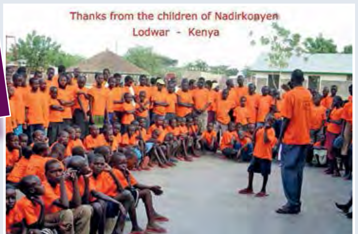
Thanks from the children of Nadirkopyen Lodwar - Kenya