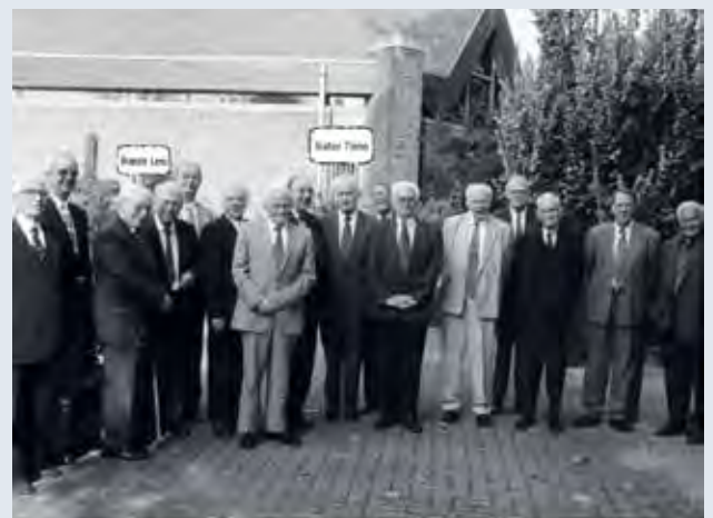
Afscheid fraters Didam op 27 september 1997