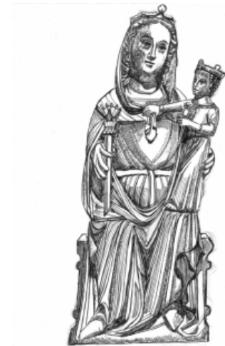
O. L. Vrouw van Renkum Moeder van Toevlucht

Het beeld is een Maiestas Mariae oftewel tronende Maria, de koningin van hemel en aarde. Zij is dan gekleed met mantel en een kroon plus een bloeiende scepter. Zij is de moeder, regentes van het koningskind, in een koningstunica gekleed en zetelend op de troon van Salomon.