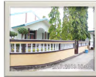
Fraterhuis St. Aloysius