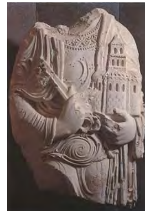
De heilige Petrus in de aankondigingskerk van Nazareth als illustratie van wat er zoal door de eeuwen heen kan gebeuren: gehavend en wel, maar de Kerk is nog heel.