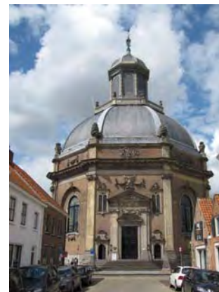
De Oostkerk is één van de prachtige monumenten in het historische centrum van Middelburg; het is één van de eerste kerken in Nederland die voor de Protestantse erediensten werd gebouwd in de 17 e eeuw.