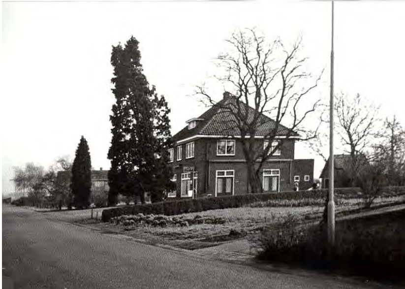
Ons huis toen het pas gebouwd was. De eerste verdieping in zijn geheel is de bovenzaal. Ikzelf sliep op de kamer beneden links op de foto.

wel gegraven, maar we hebben er nooit in gezeten, wel doken we allemaal onze eigen huiskelder in als mijn vader ons 's nachts allemaal uit ons bed roept bij gevaar. Opnieuw komt de meester naar mijn vader als we onze radio's moeten inleveren. De meester heeft twee radio's, de oude levert hij in en de nieuwe brengt hij naar mijn vader, want hij voelt gevaar voor zijn leven als de Duitsers zijn huis komen doorzoeken. Mijn vader verbergt de radio achter een dubbele wand van één van onze vijf kippenhokken. Die hokken zijn nodig voor de kuikens die onze vier broedmachines uitbroeden. Broers van mijn vader komen stiekem luisteren naar radio Oranje: "Pom, pom, pom, poaoaoam..." En op een avond horen we: 'Warschau is gevallen!' Euforie!