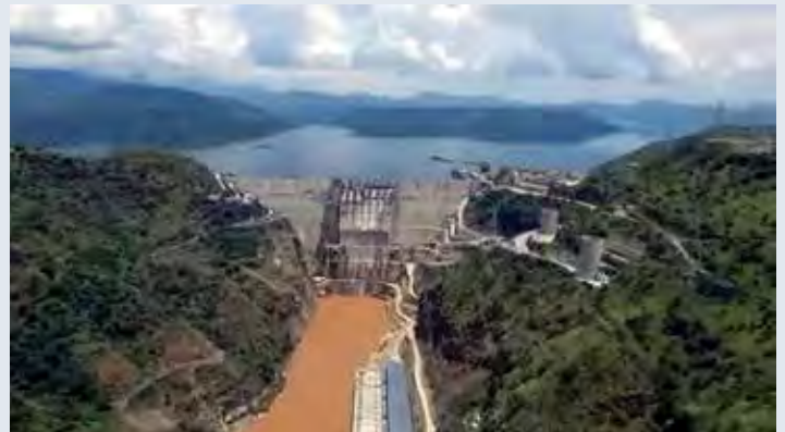
Gilgel Gibe III dam in Ethiopië

In Ethiopië wordt een hydro-elektrische stuwdam in de Omo-rivier gebouwd, de Gibe III, die grote gevolgen heeft voor de Turkanabevolking. De Omo-rivier is de belangrijkste bron van het Turkana-meer. Het meer is van levensbelang voor 300.000 Kenianen. De stuwdam wordt operationeel in het midden van 2017. Het gevolg is dat het meer snel opdroogt, het water-