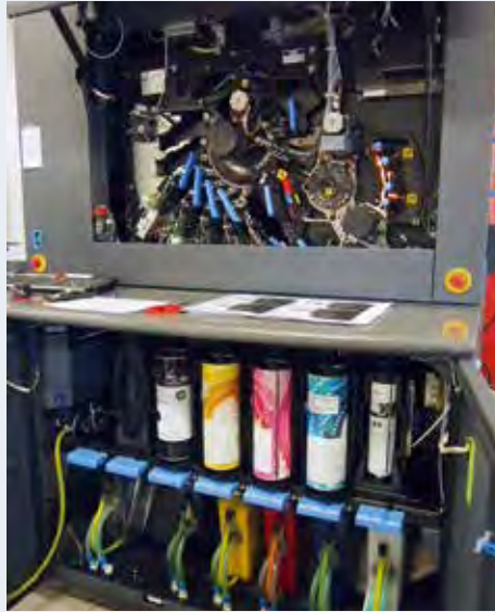
Kijkje in de digitale drukpers

Aangezien deze qua omvang relatief bescheiden activiteit niet goed paste binnen een groot grafisch concern werd in 1981 door de hoofddirectie van De Koninklijke