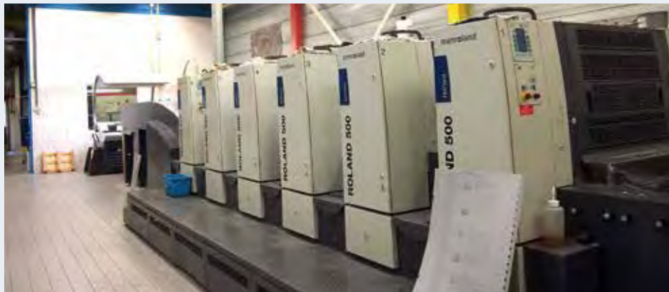
Eén van de drukpersen van Libertas