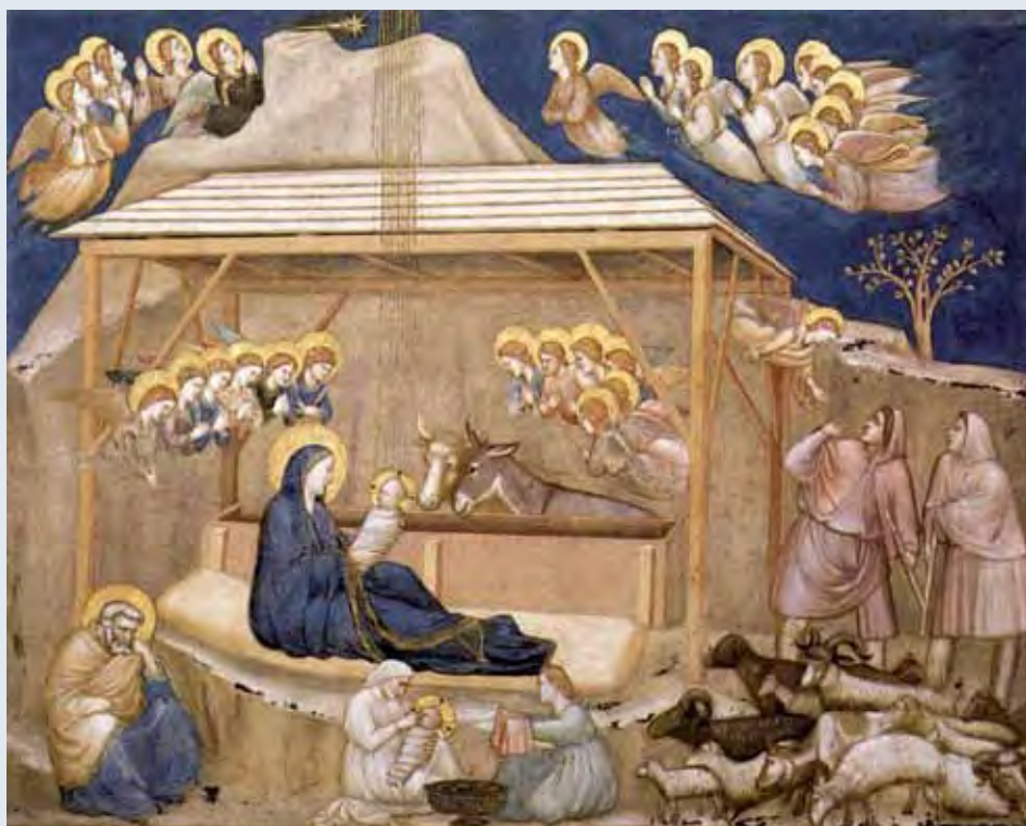
'De Geboorte van Christus' Van een leerling van Giotto, de anonieme Maestro di San Nicola Basiliek, Assisi.