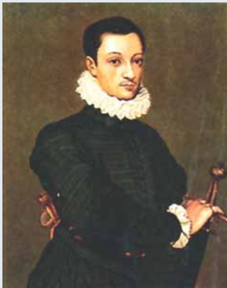
De heilige Jezuiet Aloysius Gonzaga