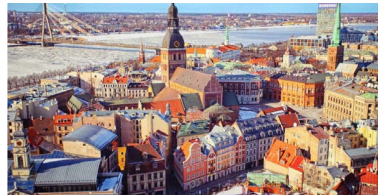
Riga, met op de achtergrond de dichtgevroren Daugava