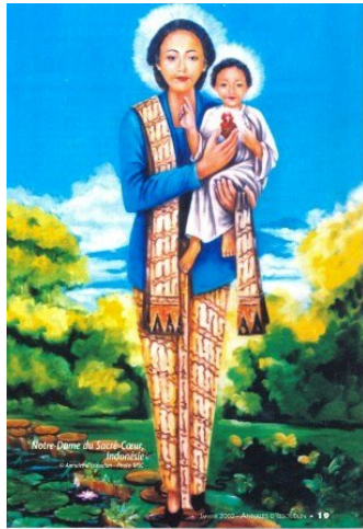
Bunda Hati Kudus

Met dank aan Inge Kapitan voor het tolken