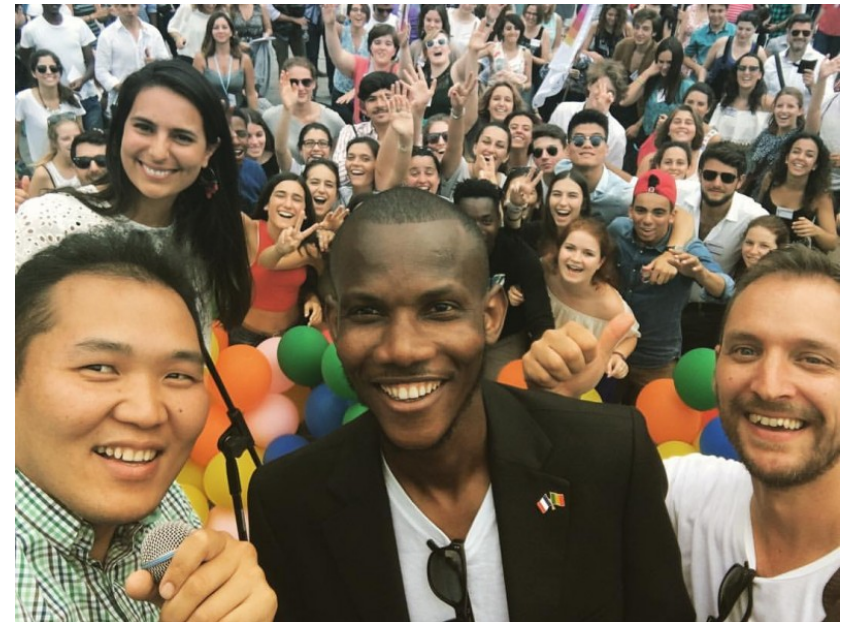
Paus Franciscus zegt: 'De mensheid kan oorlogen en conflicten alleen overwinnen als we onze medemensen als zusters en broeders beschouwen'