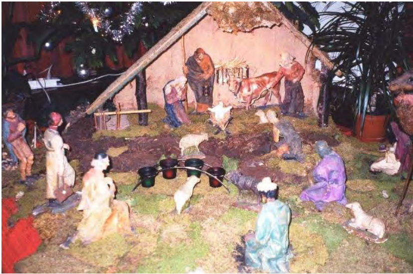
Kerstgroep uit het St.-Gregoriushuis, 1960, uit de nalatenschap van fr. Servatius van Diemen.

Over het algemeen mag ik aannemen dat alle leden van onze congregatie met het fenomeen “kerststal of kerstgroep” zijn opgegroeid. Misschien in Indonesië niet allemaal, want sommigen zijn op latere leeftijd overgegaan naar de katholieke kerk, al of niet individueel of met het gezin.