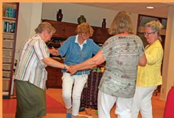
dansende vrijwilligers en bewoners en zingende fraters