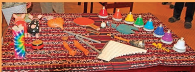
en ter afsluiting het septemberfeest met muziek,