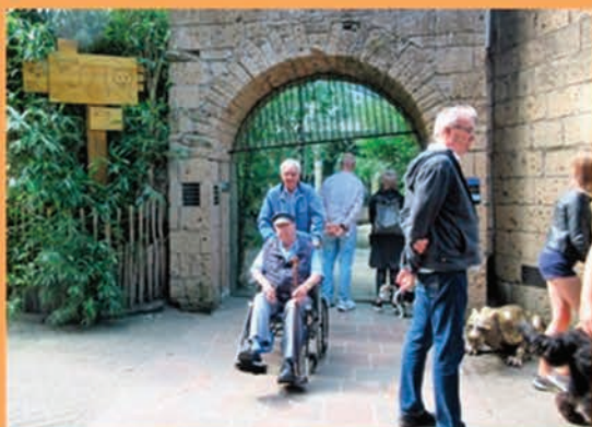
naar de dierentuin