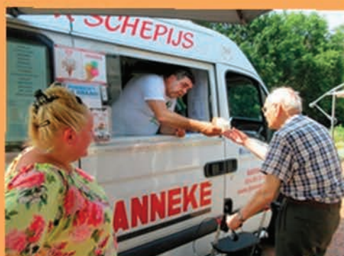
toen het zo heet was..... de ijscoman aan huis